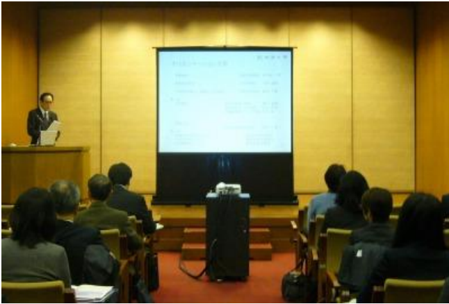
(オリエンテーションの様子)