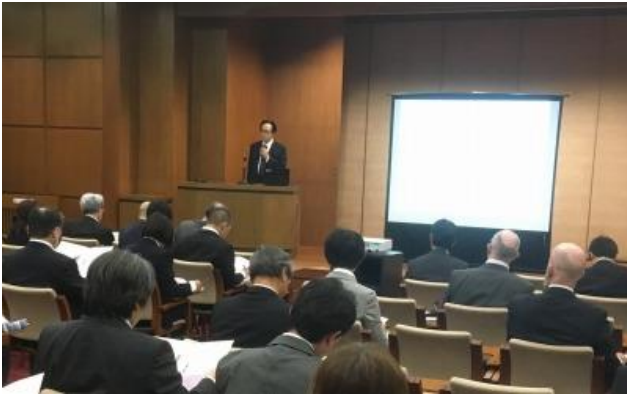
（オリエンテーションの様子）