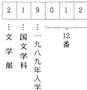
学部・学科の番号