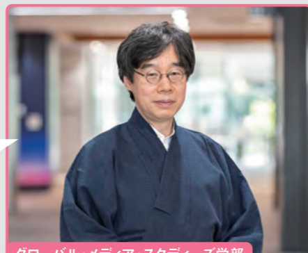
グローバル・メディア・スタディーズ学部