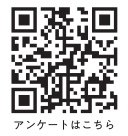
アンケートはこちら

『駒澤大学学園通信 Know』をご覧いただきありがとうございます。今後のコンテンツづくりの参考のため、右記QRコードより皆さまのご意見・ご感想をお寄せください。